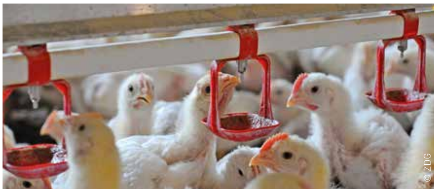
An den Wassertränken steht den Hähnchen jederzeit frisches Wasser zur Verfügung.

Der Strukturwandel in der deutschen Landwirtschaft führte in den letzten Jahrzehnten dazu, dass die Landwirte sich häufig auf eine Tierart konzentrieren. Heute ist die deutsche Geflügelhaltung arbeitsteilig organisiert und gliedert sich in mehrere Erzeugerstufen, die eng zusammenarbeiten: die Elterntierhaltung mit angeschlos-