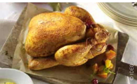
Geflügel lässt sich lecker und vielseitig zubereiten, das macht es so beliebt.

Geflügelfleisch: Heute beliebter denn je Geflügelfleisch ist bis heute ein beliebtes und schmackhaftes Lebensmittel. Der Appetit der Deutschen auf Geflügelfleisch wächst seit Jahrzehnten. Mit 19,8 Kilogramm Pro-Kopf-Verbrauch im Jahr 2015 nimmt Geflügelfleisch 22,5 Prozent des gesamten deutschen Fleischkonsums ein. Hähnchen und Pute sind die beliebtesten Geflügelarten: 2015 verbrauchte im Durchschnitt jeder Deutsche 12,8 Kilogramm Hähnchenfleisch und 5,9 Kilogramm Putenfleisch. Mit hochwertigem Eiweiß, zahlreichen wichtigen Nährstoffen und einem relativ geringen Fettgehalt kann Geflügel einen wichtigen Beitrag für eine ausgewogene Ernährung leisten. Außerdem ist es gut bekömmlich und die Auswahl sowie die Möglichkeiten der Zubereitung sind groß.